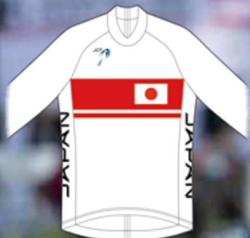
栄光のチャンピオン・ジャージ